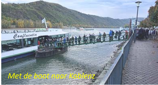
Met de boot naar Koblenz

Vanaf 8 uur een ontbijt met een buitengewoon uitgebreide keuze. Hoewel de routing (nog) niet helemaal je dat is, heb ik geen moment kunnen zien dat er ergens een (voedsel)tekort zou zijn. Anderhalf uur later stappen we op